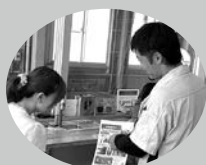
★お車の状態を詳しく説明させて頂きます!