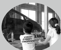
★お客様の車の作業を目の前で見学できます!